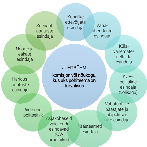
Joonis 2. Turvalisuse juhtrühma võimalike liikmete loetelu

Võimalik loetelu turvalisuse juhtrühma ja kohaliku tasandi võrgustiku liikmetest on järgmistel joonistel. Nimekiri ei ole lõplik. Eraldi on kastis toodud soovitusel võrgustikutöö toimimiseks ja korraldamiseks. 22