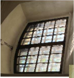
AKEN A-2 FOTO 8 VÄLISVAADE FOTO 9 SISEVAADE FOTO 10 SULUSED VÄLJAS