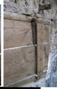
LUUK L-1 FOTO 13 VÄLISVAADE FOTO 14 SISEVAADE FOTO 15 SISEVAADE FOTO 16 RIIV