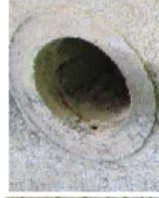
AKEN A-3 FOTO 11 SISEVAADE FOTO 12 VÄLISVAADE