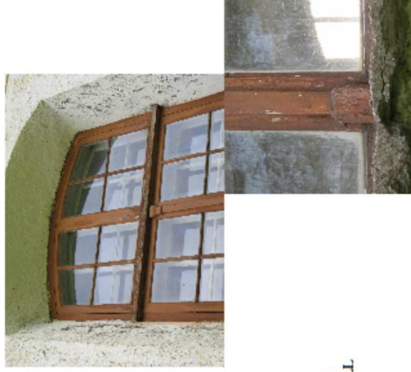
AKEN A-1 FOTO 1 VÄLISVAADE FOTO 2. RAAMI DETAILID FOTO 3 RAAMI DETAIL ALL