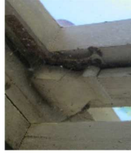
FOTO 4 SISEVAADE FOTO 5 RAAMI DETAIL ÜLAL FOTO 6 RAAMI DETAIL ALL FOTO 7 HING