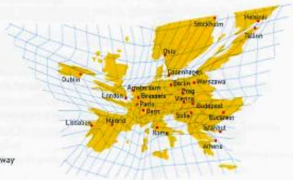
Figure 2. Travel times (time-space distances) on railway (according to Klaus Spiekermann)