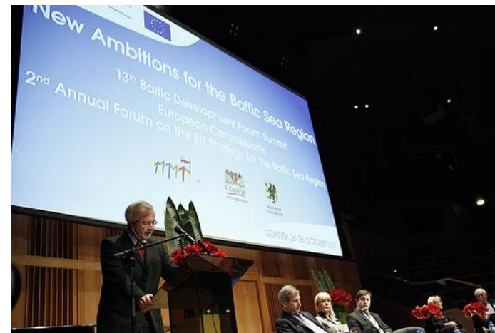
Foorumil pidas kõne Werner Hoyer, Saksamaa välisministeeriumi riigiminister

Läänemere Strateegia kolmandat aastafoorumit võõrustab 2012. aasta juunis järgmine Euroopa Liidu esistujamaa – Taani. Eestis on Läänemere Strateegia koordinaatoriks Välisministeerium.