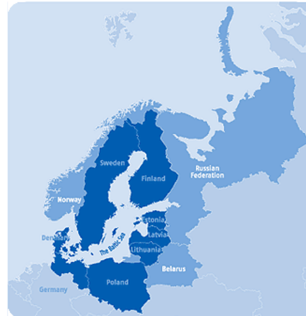
Baltic Sea Region Programme area 2007 - 2013

ja omaks võtta; (2) sisemine ja välimine ligipääsetavus, mille osas on olulisteks teemadeks ühiste riikidevaheliste lahenduste loomine